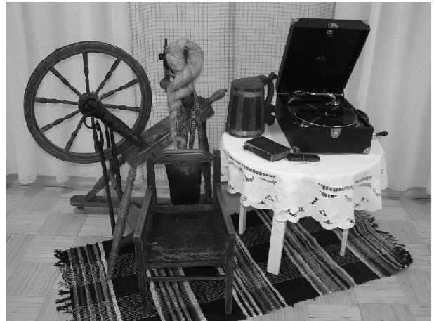
Lapsed võisid kuulda muusikat sajandivanuselt grammofonilt

Külas olid veel kaks tudengineidu Leedust Tamsalu sõpruslinnast, kes õpivad eesti keelt. Nendele jäi meie lasteaiaist väga hea mulje, kiituse pälvivid lapsevanemad, et nad leidsid aega ja tahtmist laupäeval lasteaeda tulla. Väga meeldisid meisterdused