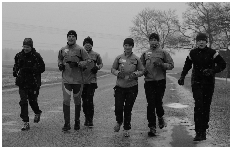
Joostes treeneriga matkalt tagasi

Tamsalu Vallavalitsus võtab lapsehoolduspuhkusel viibiva ametniku asendamiseks tööle