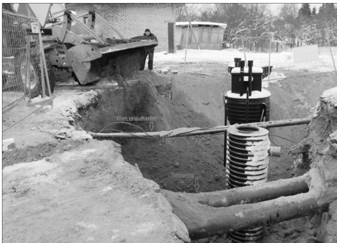
На перекрестке шоссе Пайде и улицы Эха появилась новая насосная станция.

Руководители самоуправлений радуют увеличение поступлений от подоходного налога, это ведь дополнительные средства местных бюджетов. В то же время не понятно, с какой целью Минфин Эстонии требует создания неких накопительных фондов. Это требование министерство собирается узаконить для самоуправлений, где дополнительные поступления от подоходного налога превышают 5% от запланированных годовых бюджетов.