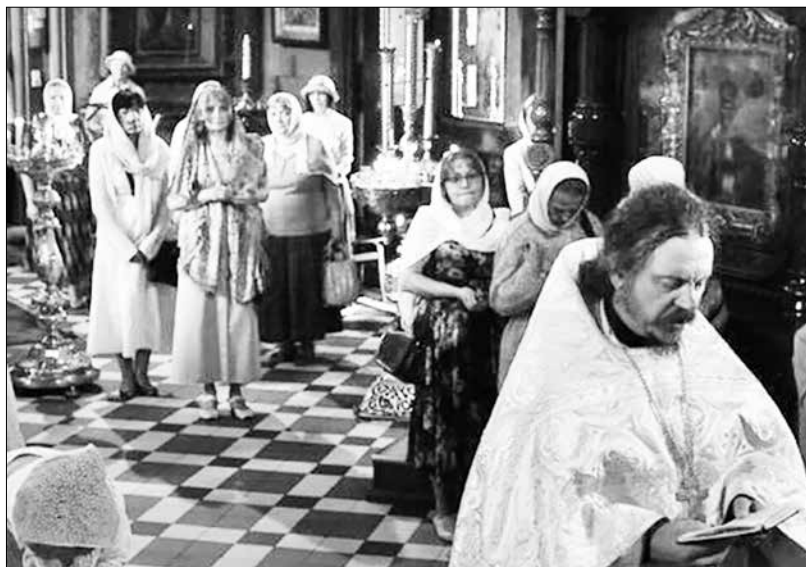
Жизнь прихода одинаково зависит от прихожан и настоятеля.

По убеждению Годунова, священник является духовным наставником прихожан, поэтому и его жизнь и служение Богу должны быть примером для окружающих. Вот поэтому для него