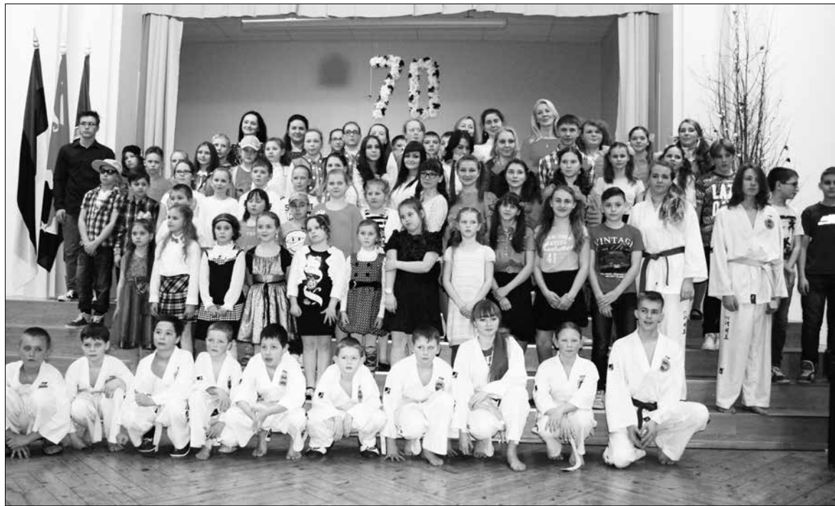
Участники и организаторы юбилейной программы в Русской гимназии.

Прибывшие военнослужащие США прослужат здесь три месяца и примут участие в учениях Кайт-селийт «Волк» и в масштабных учениях «Еж-2015».